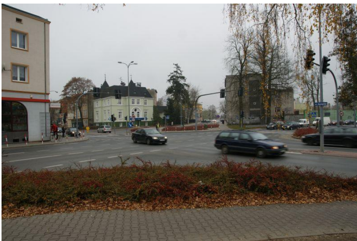
przebudowa skrzyżowania Zwycięstwa – Pileckiego (rondo)

Najważniejsze inwestycje: usprawnienie drogi krajowej nr 11 (30,4 mln zł), ulice: Połczyńska (4,56 mln zł), Powstańców Wielkopolskich (0,45 mln zł), Stawisińskiego – Pileckiego (3,1 mln zł), Chałubińskiego (3,65 mln zł), Wańkowicza (0,35 mln zł), budowa łącznika z obwodnicą Koszalina (2,0 mln zł), kontynuacja budowy ścieżek rowerowych (4,3 mln zł).