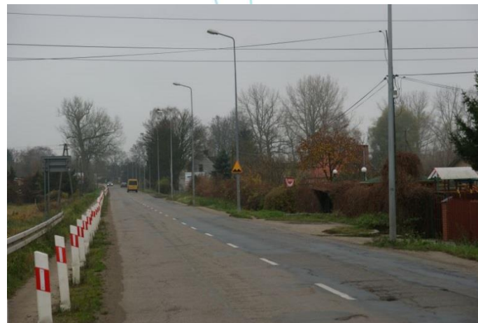
przebudowa ul. Połczyńskiej