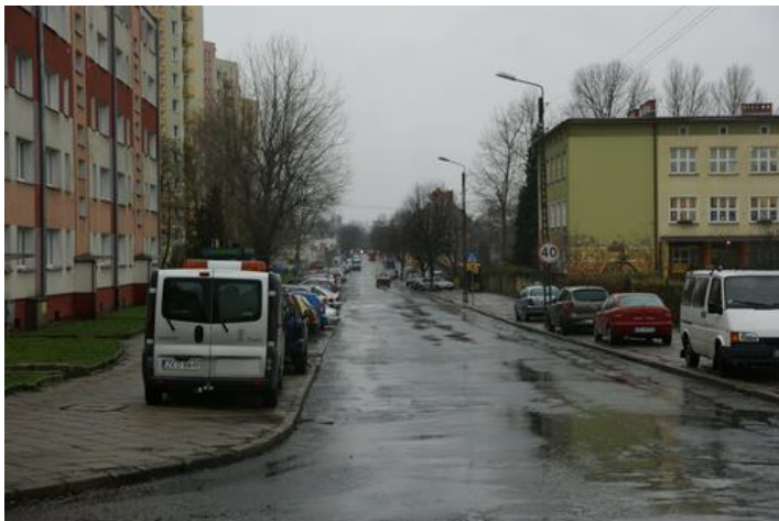
przebudowa ul. Powstańców Wielkopolskich